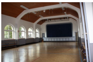
Salle de gymnastique (They 1)