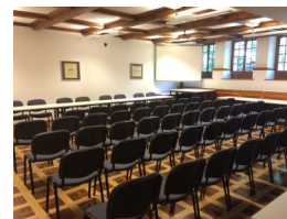
Salle du Conseil (They 1) Beamer et écran, mobilier

Le règlement d'utilisation, le formulaire de location et toutes les autres salles sont disponibles sur le site internet de la Commune : https://veytaux.ch/locations-de-salles-et-refuges